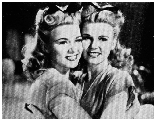
Le gemelle Wilde

Due coningi, Mary Hale professoressa di pedagogia, e Jeff Turner, giornalista, benchè in fondo si vogliano ancora bene, hanno fatto divorzio, non riuscendo a mettersi d'accordo circa l'educazione delle due figlie gemelle. Quando Mary ritorna, con la figlia Stephanie, da un trionfale giro di conferenze del Sud-America, Jeff va ad intervistarla per il suo giornale, Mary chiede a Jeff di farle rivedere Terry, l'altra gemella, che vive con lui, e Jeff accoglie la sua richiesta: ha luogo così un incontro a quattro in casa di Jeff. Terry e Stephanie, che s'assomigliano perfettamente nel fisico, hanno avuto uno sviluppo spirituale affatto diverso. Malgrado questo si vogliono bene ed auspicano la riconciliazione dei genitori, per poter vivere insieme. Per toglier di mezzo