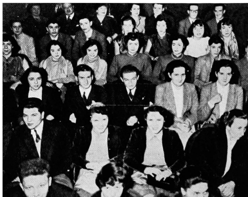
I gemelli di Parigi a teatro

A proposito di gemelli francesi, riproduciamo la fotografia di un settore del teatro parigino dove i gemelli della città furono invitati ad assistere alla prima rappresentazione della commedia di Jean Le Marois « Double-Blanc » le cui protagoniste sono due gemelle. La direzione del Teatro, a scopo pubblicitario, aveva chiamato a raccolta i gemelli della capitale riservando loro gratuitamente un largo numero di posti; ma non si era tenuto conto a sufficienza che i gemelli, in una grande città come Parigi, sono numerosissimi; sicchè, all'atto pratico, una parte di essi dovette essere rimandata.